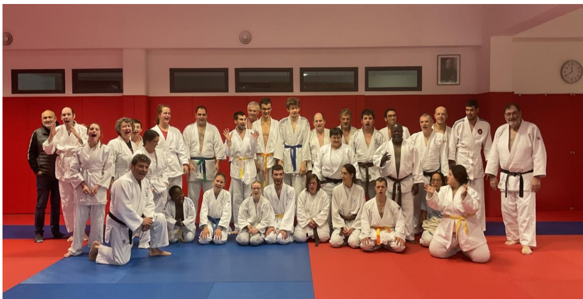
Groupe Handi 78 – Entraînement du 1 er octobre 2022 Saint Rémy les Chevreuses